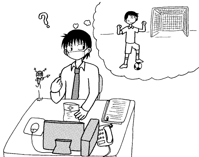
長期間の運動習慣が白血球の殺菌能力に影響を与えない

先行研究では疲労困憊となるような急性の運動、あるいは試合前の激しいトレーニング期間には殺菌能力の低下が見られていますが、長期間の運動習慣が殺菌能力を低下させるという証拠は本研究では証明されませんでした。