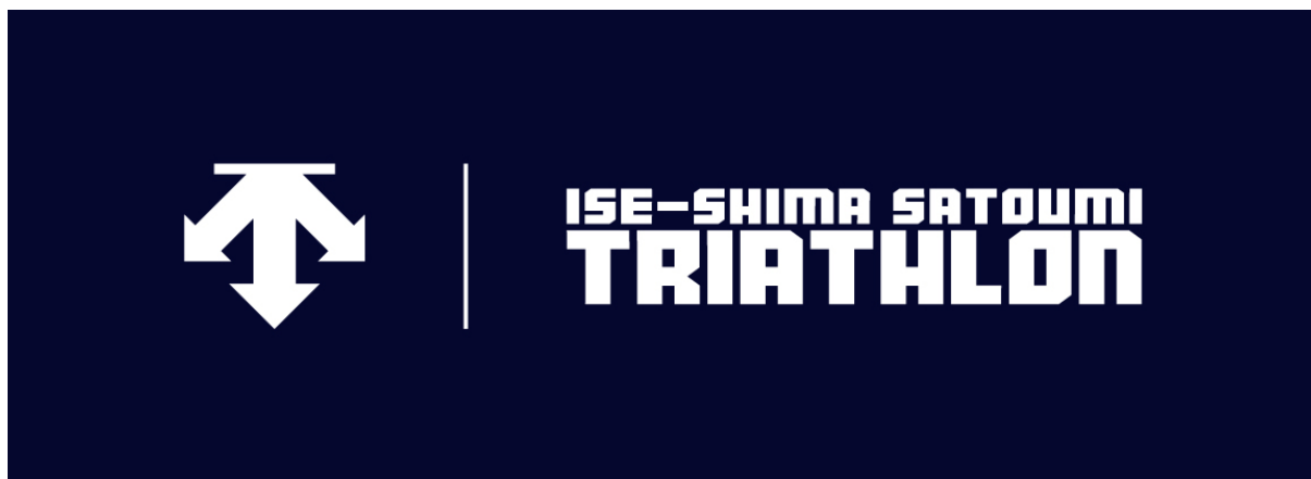
伊勢志摩・里海トライアスロン大会 2026 大会ロゴ

目的： メインスポンサーとして大会運営を強力にバックアップするとともに、後述する「DESCENTE TRIATHLON CLUB」のメインイベントとして位置づけ、参加者とのダイレクトな接点を創出します。