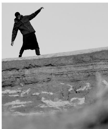
SYNTHETIC TWEED 1,000FP DOWN JACKET