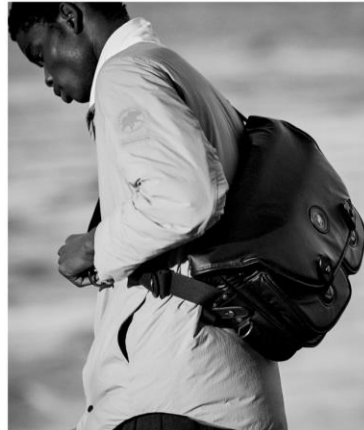
INNER DOWN CROSS PLEATS LONG SLEEVED JACKET