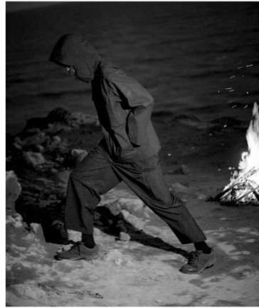
HARD SHELL FIELD JACKET