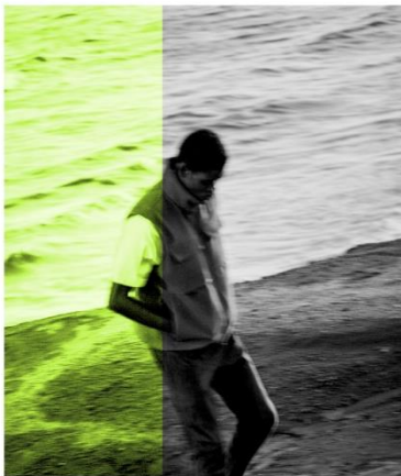
SYNTHETIC TWEED 1,000FP DOWN VEST