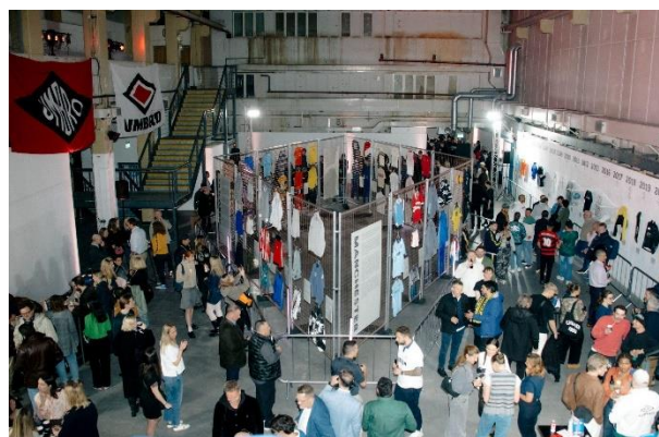
▲エキシビションの様子