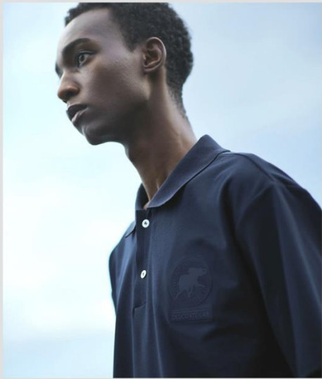
PRIMEFLEX® DOUBLE TAILORING S/S POLO SHIRT DHMXJA43