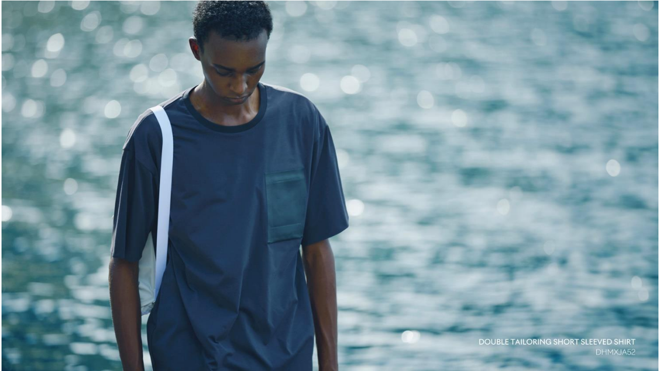
DOUBLE TAILORING SHORT SLEEVED SHIRT DHMXJA52