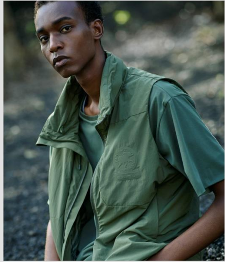
SHRINK CLOTH VERSATILE VEST DHMXJK04