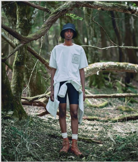
PRIMEFLEX® PLATING JERSEY S/S SHIRT DHMXJA51