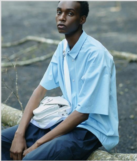
CARRYALL SHOULDER BAG SMALL DHAXGA02