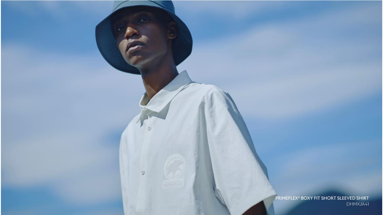
PRIMEFLEX® BOXY FIT SHORT SLEEVED SHIRT DHMXJA41