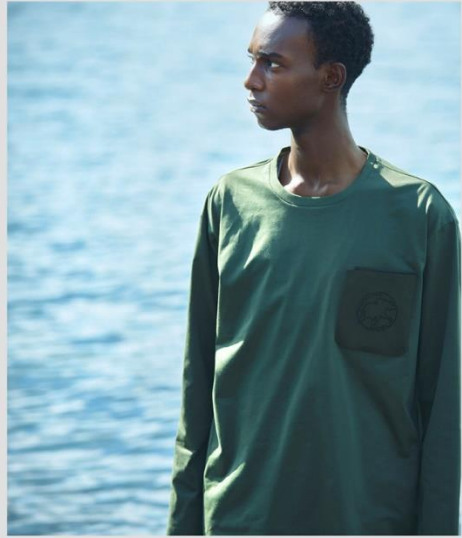
PRIMEFLEX® PLATING JERSEY L/S SHIRT DHMXJB50