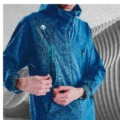
ポケット兼ベンチレーション

軽いランニングやウォームアップに適したストレッチ素材のジャケットとテクニカルなランニングシューズ。ジャケットの左右のポケットは内側がメッシュ生地になっているため、ファスナーを開けるとベンチレーションにもなります。パンツのウエスト後ろ側にはメッシュゴムを配置し、腰周りの汗冷えを軽減。切り替えベンチレーションを配置し、スマホなどを収納できるポケットも搭載。足上げ時の生地のおっぴり感を軽減するスリットや、縫い代を表に出すことで肌面をフラットにし連続する足上げによる摩擦を軽減し、着用快適性を実現しています。