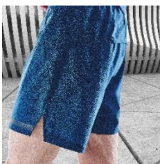
スリットと夜間の視認性を考慮した再帰反射