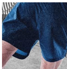
背面のベンチレーション