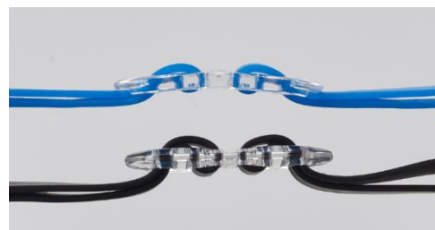
（上：本製品 下：従来品）

ストラップアジャスター部分をカーブ形状に改良することで、アジャスターとストラップが後頭部に沿うようにフィットし、アジャスター部分の厚みを減らすことで流水抵抗の低減とゴーグル全体のフィット感の向上を実現しました。