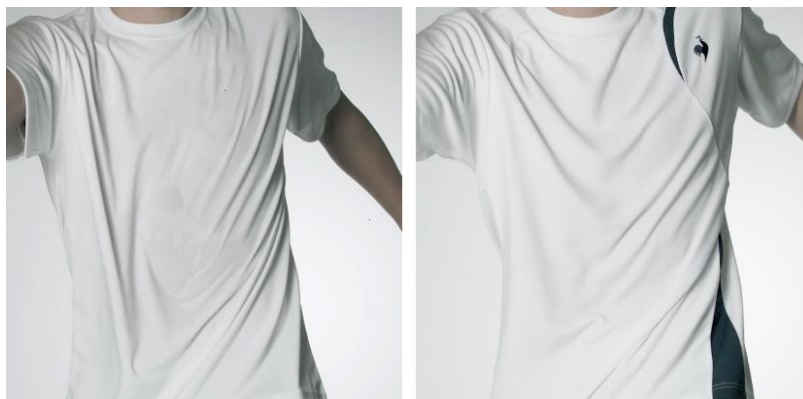
約20mlの水を吹きかけた後の一般的なポリエステルTシャツ（左）と「EXcDRY D-Tec」を使用したTシャツ（右）を比較