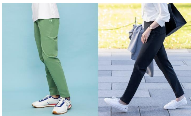
同一商品で動きやすさ(左)と“きちんと見え”(右)を両立

「ルフ フォルム」設計を採用しているので、座りっぱなしの姿勢や通勤時の自転車、階段の昇り降りの際に気になるお尻や太もも回りにストレッチ性があり、動きやすさを実現しています。また、このアイテムの特徴として、サラッとした肌触り、細身なシルエットに加え、ウエストはゴムで履きやすくなしながら、前部分はフラット、後ろ部分にギャザーを寄せることにより、トップスをインしても“きちんと見え”するよう配慮しています。