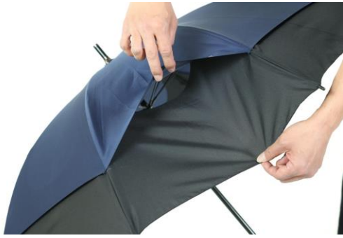
ベンチレーション