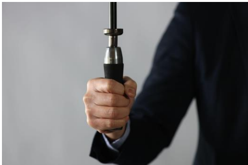
握りやすいストレートグリップ