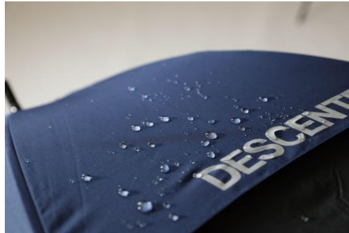
はっ水加工で水を弾く様子