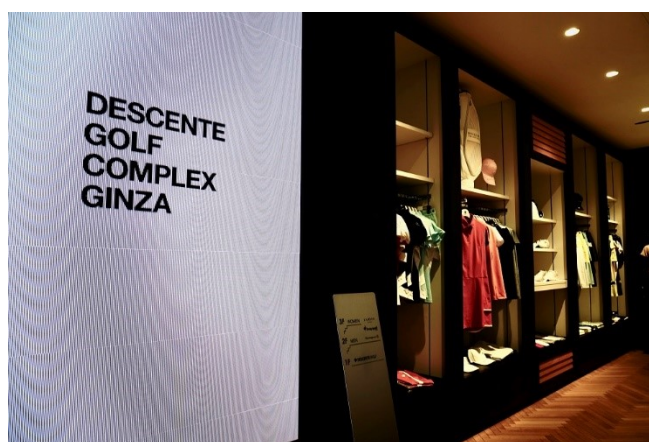
左：店舗外観、右：店舗入口