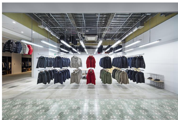
※ 「DESCENTE BLANC」他店舗イメージ画像