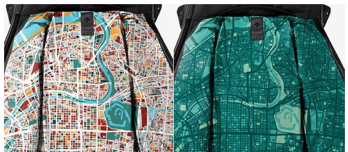
↑梅田の店舗限定の裏地は、大阪の地図をイメージ

「DESCENTE BLANC 梅田」では、オープンを記念して「デサント オルテライン」の象徴的アイテムである高機能ダウンジャケット「水沢ダウン」を自分好みにカスタマイズできる“MADE TO MEASURE（メイドトゥー メジャー）”サービスを期間限定で実施いたします。