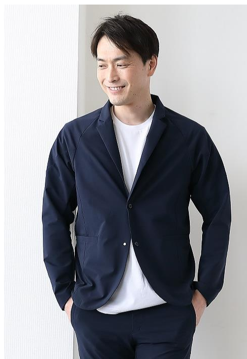
すっきりと整って見えるよう こだわったシルエット