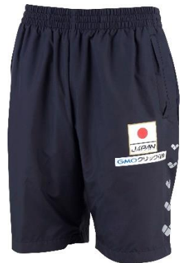
その他の主なパンパシフィック水泳選手権大会 2018 日本代表選手サプライ商品 (左) ポロシャツ (中央) Tシャツ (右) ハーフパンツ