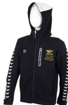
金メダリストに贈られる チャンピオンジャケット