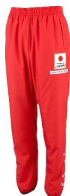
胸元にフラッシュで光る桜の デザインが施された ウインドジャケットと セットアップのパンツ