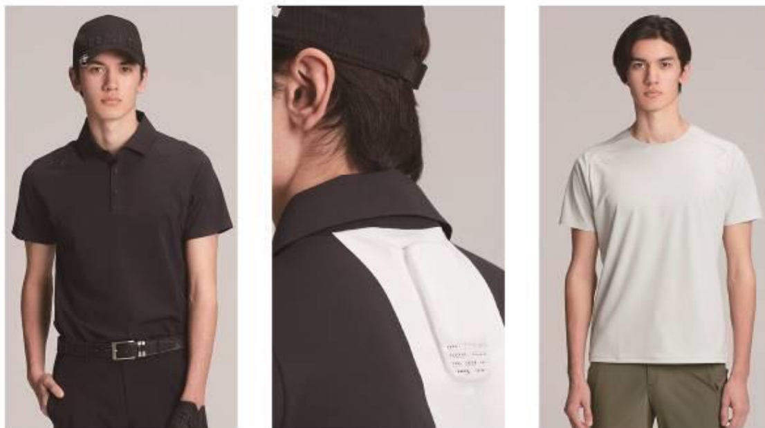
<写真：左・中央> デサント（ゴルフウェア）