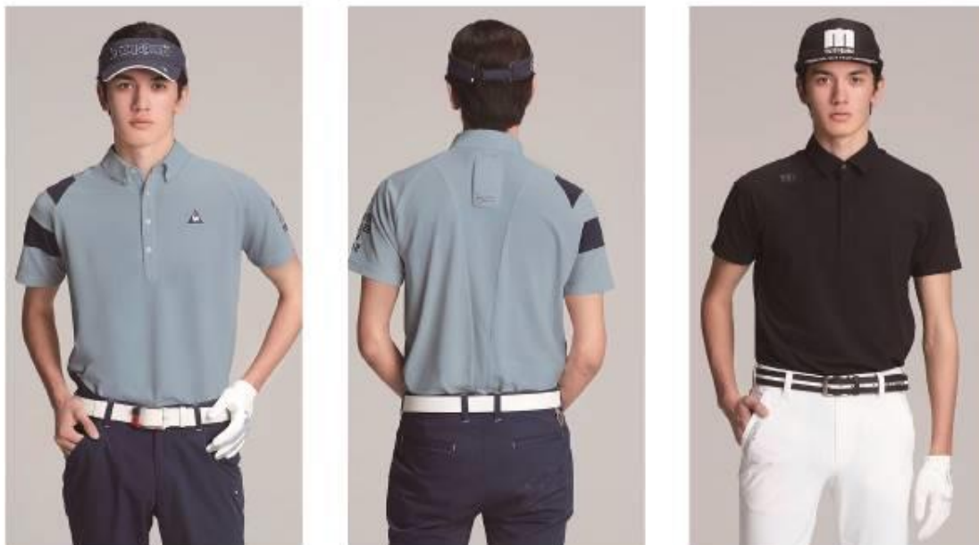
<写真：左・中央> ルコックスポルティフ（ゴルフウェア）