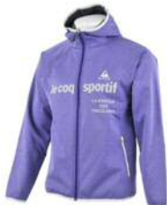
アッシュトパープル(APL)