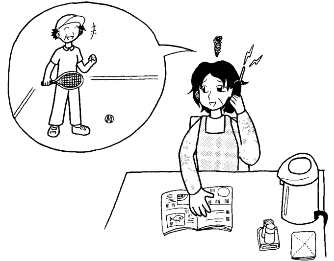
更年期不定愁訴は、低強度の運動でも緩和できるようだ

体力の向上や動脈硬化の危険因子の改善には中等度以上の運動強度が推奨されていますが、更年期不定愁訴には低強度の運動でも効果があること、またこの効果は身体面の変化とは独立している可能性が示唆されました。